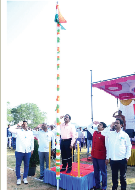
జాతీయ జెండాకు నమస్కరిస్తున్న రిజిస్ట్రార్

చేయాలన్నారు. భారతదేశంలోని ప్రజలందరూ రాజ్యాంగఫలాలు అందుకుంటూ దేశ అభ్యున్నతికి ప్రయత్నించాలన్నారు. ప్రజలందరూ దేశభక్తిని పెంపొందించుకుంటూ దేశ అభివృద్ధికి సమాజ శ్రేయస్సుకు తోడ్పాటు నందించాలన్నారు. ప్రతి ఒక్కరూ తమ తమ విధులను త్రికరణ శు ద్ధిగా నిర్వహిస్తూ బాధ్యతగా మెలగాలని సూచించారు. తద్వారా దేశం, విశ్వవిద్యాలయం ప్రగతి పథంలో పయనిస్తుందని తెలియజేశారు. తరువాత