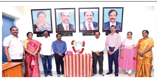
నేతాజీ చిత్రపటానికి పూలమాలలు వేసి నివాళులర్పిస్తున్న వీసీ